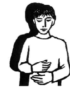
Bóg w Synu jest w nas