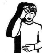
W imię ... Bóg jest naszym Ojcem