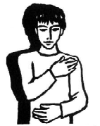
Bóg w Duchu Świętym jest w nas