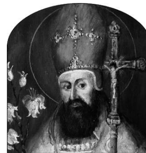
Bl. Radzim Gaudenty – pierwszy biskup gnieźnieński.

Był przyrodnym bratem św. Wojciecha i od wczesnych