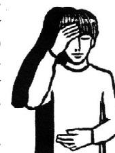
W imię ... Bóg jest naszym Ojcem