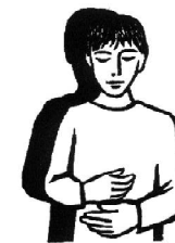
Bóg w Synu jest w nas