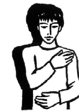
Bóg w Duchu Świętym jest w nas